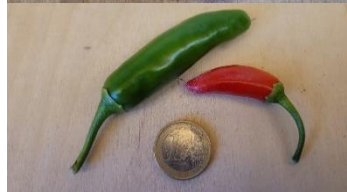
TABASCO GREEN LEAVES

Eine schöne Pflanze , deren aufrechtstehende Früchte von Gelb auf Rot abreifen. Die Pflanze lässt sich problemlos im Haus überwintern und hält sich viele Jahre als Topfkultur .