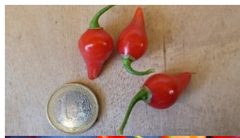
TRÄNEN ALLAHS ROT